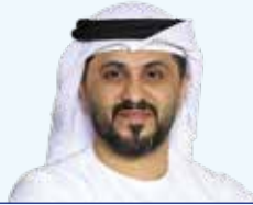
حسن الحوسني الرئيس التنفيذي لشركة بيانات للحلول الذكية

علي الهاشمي هو الرئيس التنفيذي لشركة الياه سات للخدمات الفضائية، التابعة لشركة سبيس 42، والتي تركز على تشغيل وتوفير خدمات الأقمار الصناعية الثابتة والمنتقلة. سابقاً، تولى الهاشمي منصب الرئيس التنفيذي لمجموعة الياه للاتصالات الفضائية ش. م. ع حيث أشرف على الأعمال خلال فترة اندماجها مع «بيانات» لإنشاء «سبيس 42» في عام 2024 وطرحها العام الأولي في سوق أبوظبي للأوراق المالية في عام 2021. يتولى السيد/ علي الهاشمي أيضاً عضوية اللجنة التنفيذية لمجلس الإمارات للمستثمرين الدوليين ومجلس إدارة المركز الوطني لعلوم وتكنولوجيا الفضاء.